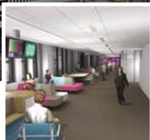
Impressie van het wachtgebied aan daglicht bij de poliklinieken.