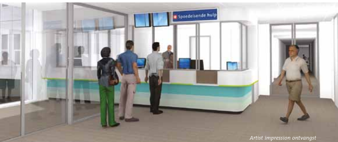
Artist impression ontvangst