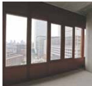
Uitzicht vanaf een verpleegafdeling op de andere gebouwdelen.