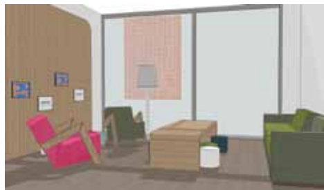
Artist impression wachtgebied kinderen

De parkeergarage Wytemaweg sluit direct aan op het nieuwe publieksgebied en is vanaf de centrumzijde goed bereikbaar.