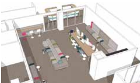
Artist impression wachtgebied volwassenen