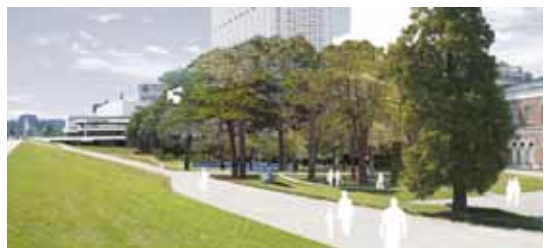
Aan de zijde van de Westzeedijk wordt tussen het Erasmus MC en het Natuurhistorisch Museum het park opnieuw aangelegd. De werkzaamheden zijn eind mei 2014 klaar. In november en december 2014 worden de bomen geplant.