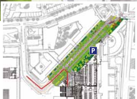
Wytemaweg met ambulanceroute en parkeergarage voor bezoekers Erasmus MC

In 2016 en 2017 wordt de Zimmermanweg en het dr. Molewaterplein voor de nieuwe hoofdingang van Erasmus MC heringericht. Het definitief ontwerp hiervoor bevindt zich in de afrondingsfase.