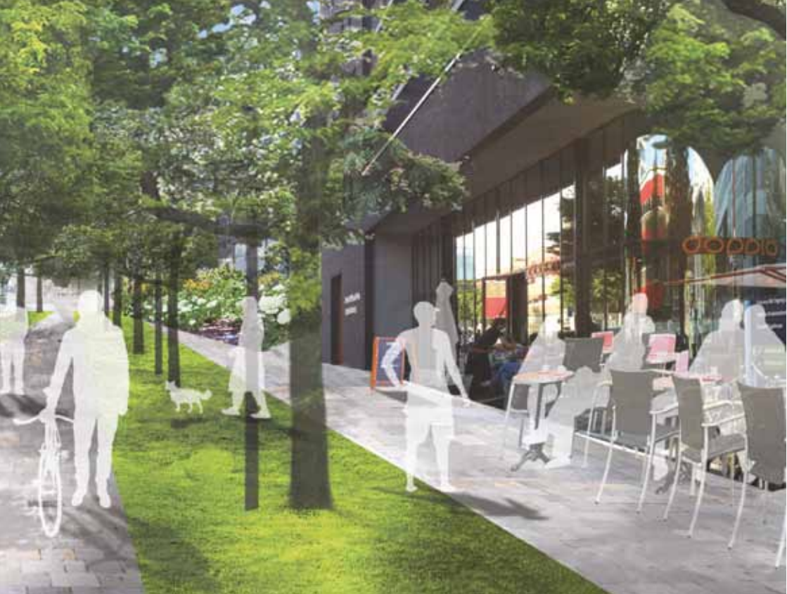
Artist impression nieuwe situatie Wytemaweg